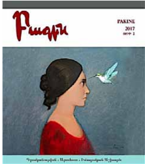
«Բագին» Ապրիլ-Յունիս 2017 (ԾԶ. ՏԱՐԻ, ԹԻԻ 2)

Գրութիւններ ունին Զաւէն Պիպեռեան, Յարութիւն Քիրքճեան, Յարութիւն Պերպերեան, Ճէսի Արլէն, Խաչիկ Տէր Ղուկասեան, Խաչիկ Տէտէեան, Վարդան Մատթէոսեան, Դալար Շահինեան, Բաֆֆի Աճէմեան և Անահիտ Տէր Մինասեան: >>>