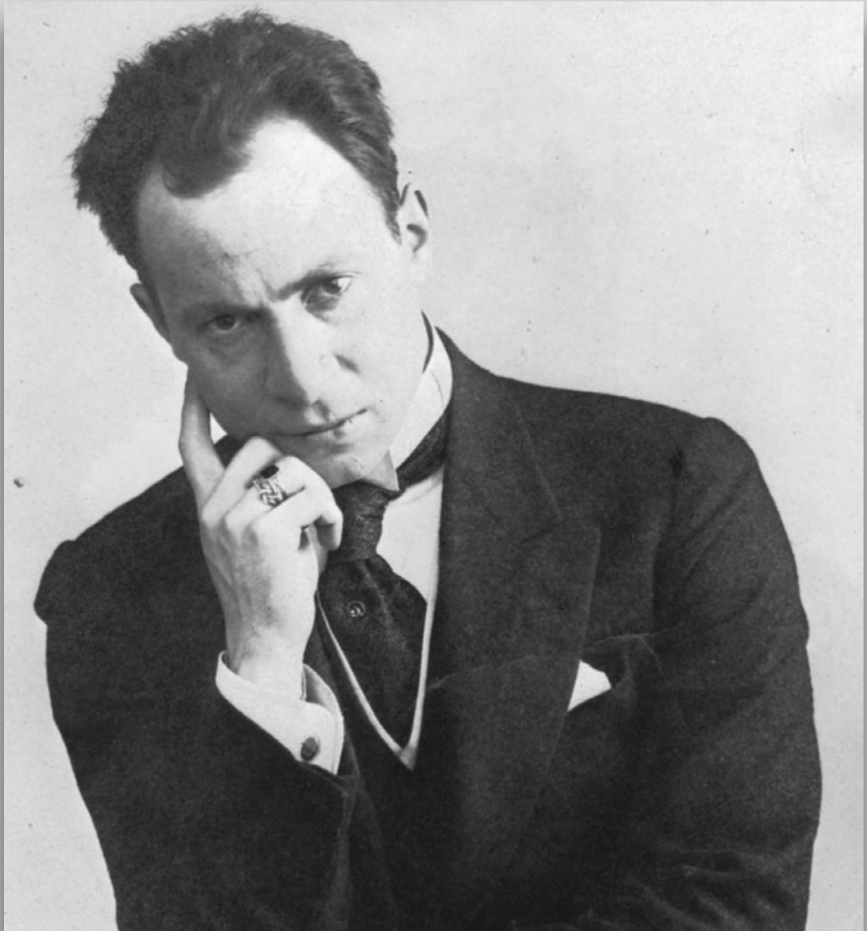
Մուսիկն Էրթուղրուլ՝ երիտասարդության տարիներուն: