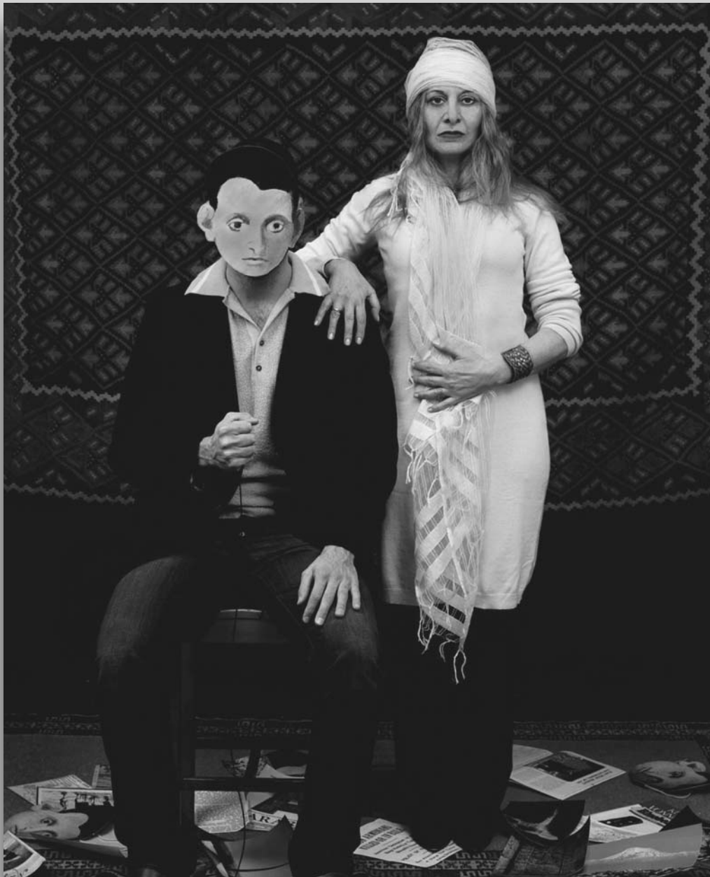
«Գնա՛ մեռիր, եկուր սիրեն», 2007 Արամ Դիպիլեան եւ Նիրի Մելքոնեան © Արամ Դիպիլեան