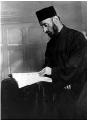
Gomitas Vartabed (1869 - 1935)

We are proud to be Armenian because we have people like...